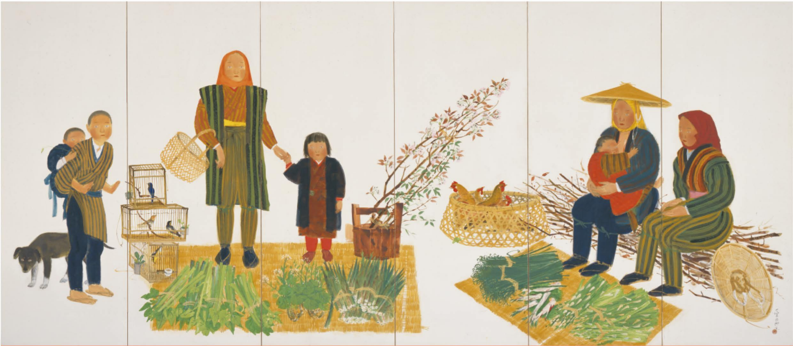
福田豊四郎《山菜売る人達》1932年（昭和7）